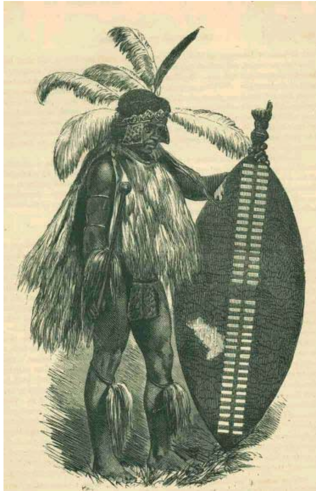
Guerreiro africano do século 19.